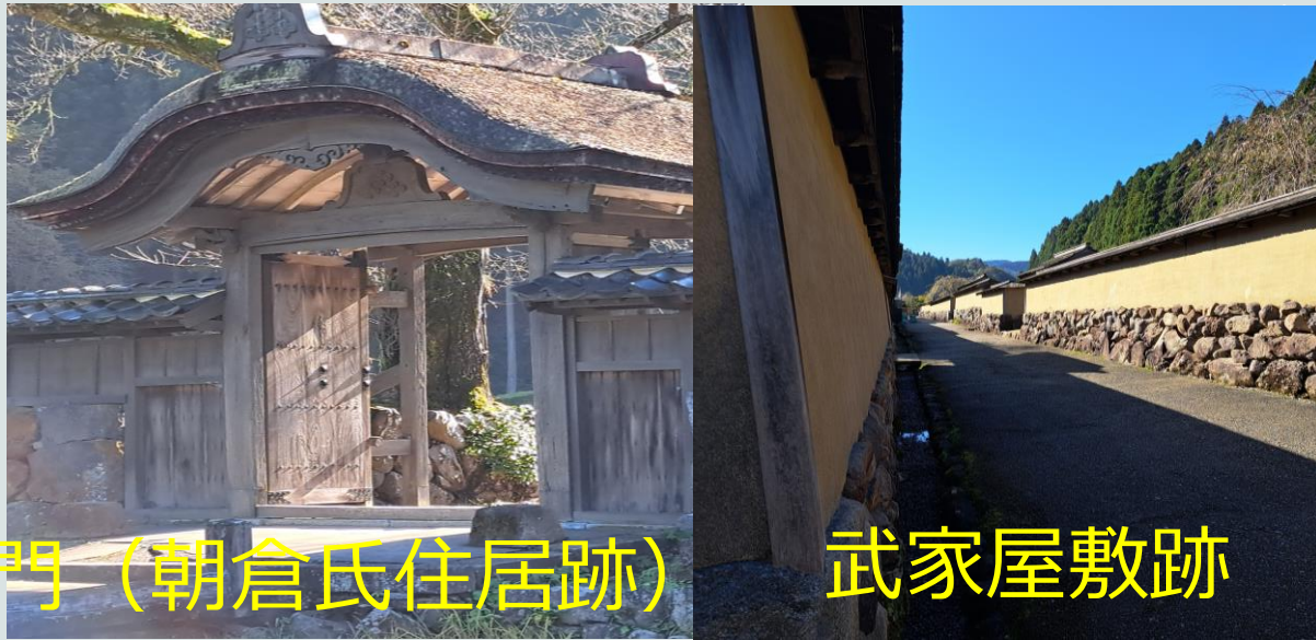
唐門（朝倉氏住居跡）