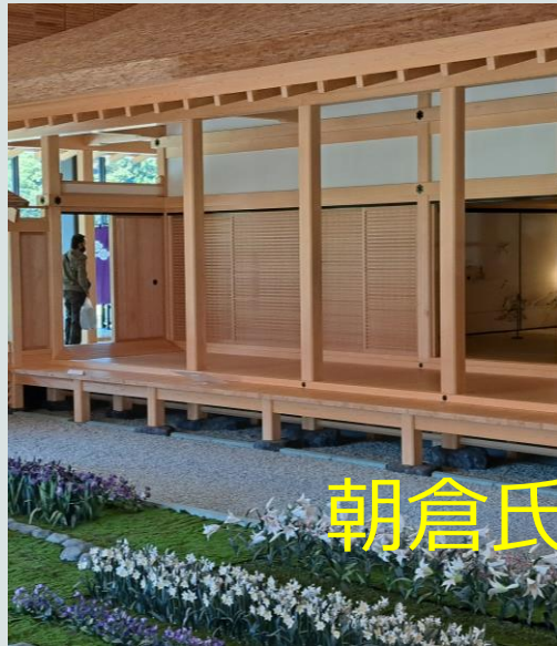
朝倉氏遺跡博物館